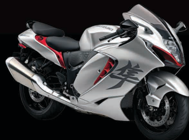
Metallic Matte Sword Silver / Candy Daring Red (B5M)