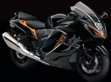
Glass Sparkle Black / Candy Burnt Gold (B5L)