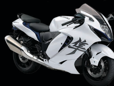
Pearl Brilliant White / Metallic Matte Stellar Blue (B5N)