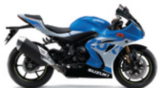
Metallic Triton Blue / Metallic Mystic Silver (GUL)