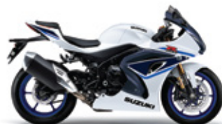
Pearl Brilliant White / Metallic Matt Stellar Blue (B5N)