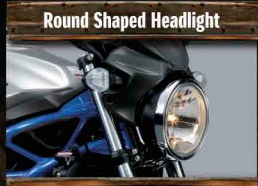
Round Shaped Headlight

What started in 1999 as a motorcycle built to deliver “V-Twin fun”, the Suzuki SV650 quickly became a rider’s phenomenon around the world. Not only was this universal motorcycle well-suited for urban roads but it was right at home on the racetrack too. Raising the “V-twin fun machine” performance even higher with latest Suzuki innovations, the SV650’s newest version now sets a higher standard. Well-beyond simply being a novice’s motorcycle, the new SV650 is a rider’s go-anywhere dream machine.