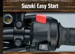
Suzuki Easy Start

ชุดแผงหน้าปัดแบบ Full LCD ขนาดกะทัดรัด นักบิดสามารถปรับแสงสว่างได้ 6 ระดับ แสดงพารามิเตอร์ครบเครื่องย่นต์, ตำแหน่งเกียร์, ความเร็วและอัตราทดเกียร์เปลี่ยนน้ำมันเชื้อเพลิง เป็นต้น