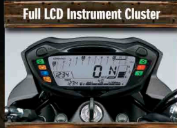
Full LCD Instrument Cluster

ไฟหน้าทรงกลมสุดคลาสสิก สวยงามที่มีเอกลักษณ์เฉพาะตัว พร้อมโคมไฟแบบมีลวดรีเฟลกเตอร์ที่ให้ความสว่างและส่องสว่างชัดเจน เพิ่มทัศนวิสัยในการมองเห็นให้แก่ผู้ขับขี่ แม้ในเวลากลางวัน