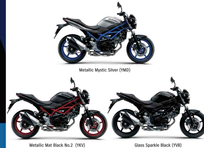
Metallic Mat Black No.2 (YKV) Glass Sparkle Black (YVB)